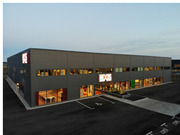
HEXIS | Landskrona (Suède)

À ce titre, HEXIS détient un grand savoir-faire dans les marchés du rail et du roulant (ferroviaire, tramway, bus).